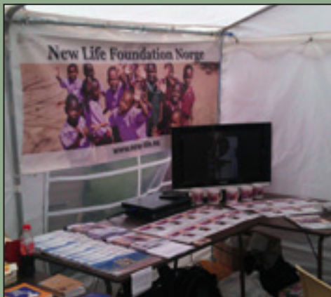
Slik så New Life Foundation sin profilering ut under Dyrsku'n i Seljord i september.

Vi var til stede med stand på generalforsamlingen til Norge I DAG på Bildøy utenfor Bergen i juni, på en stand integrert i bokkiosken under landstevnet til Maran Ata i Seljord i juli og på Sion-Kyrkja sin stand under Dyrsku'n i Seljord i september. Vi viste video og bilder fra Tanzania, delte ut blader, solgte kalendere og krus, og utfordret folk til å involvere