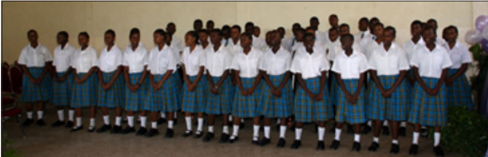
Her er noen av elevene som nå har fullført de første fire årene av Secondary School.

både gjennom måten de hjalp til med forberedelsene av feiringen, og måten de optrådte på denne dagen. De var helt enestående, rapporterer medarbeidere fra New Life Foundation Tanzania.