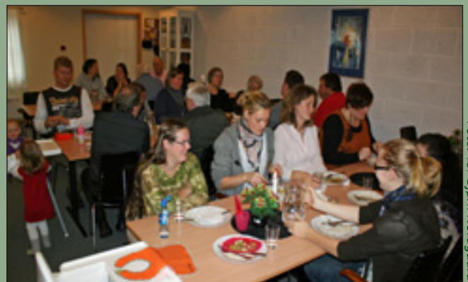
Medlemmer, faddere og andre venner av New Life Foundation sitt arbeid var samlet i Sion-kyrkja i Seljord 30. oktober.

Etter møtet var det måltidsfelleskap, og deretter ble tilhørerne tatt med til Tanzania gjennom bilder, historier, vitnesbyrd og informasjon om arbeidet. Samlingen foregikk i lokalene til Sion-Kyrkja Seljord. New Life Foundation Norge ønsker jevnlig å invitere til slike arrangement.